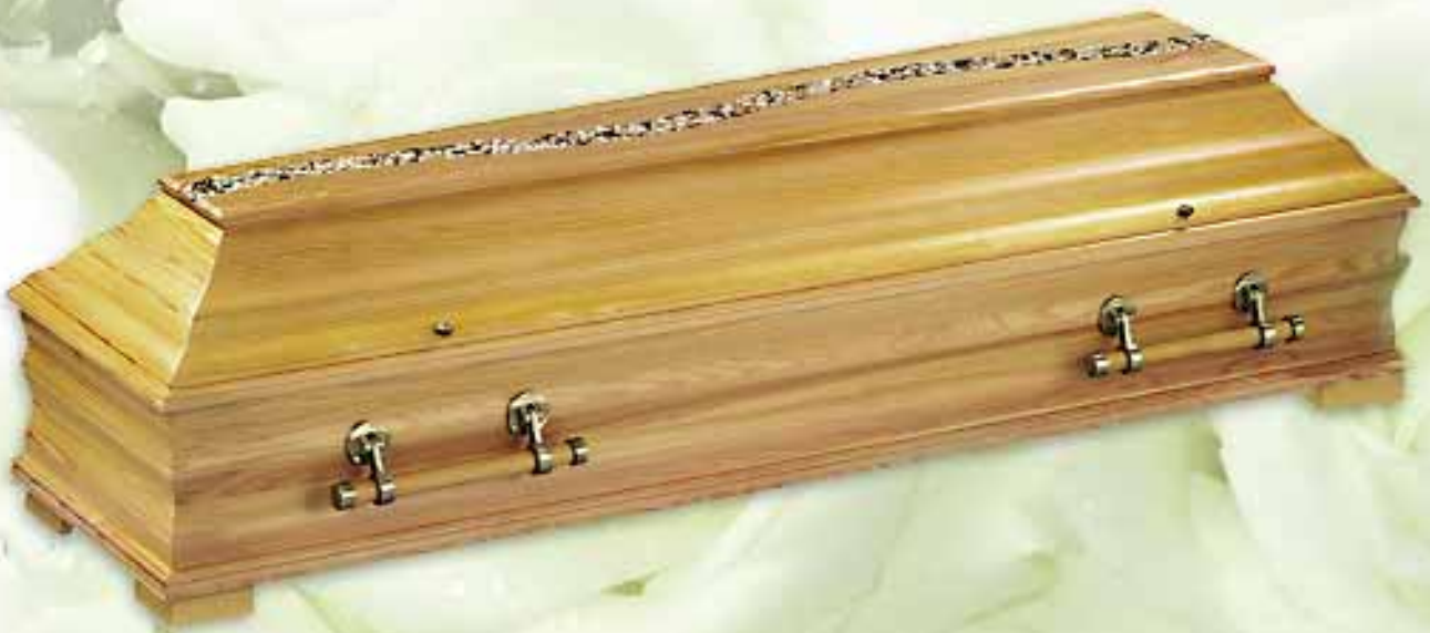
Modell: LFS-Kiesel natur

Hauptstraße 23 | A-4101 Feldkirchen/D. Tel.: +43 (0)7233/62 77 0 | Fax: +43 (0)7233/62 77 70 E-Mail: info@daxecker.at | www.daxecker.at