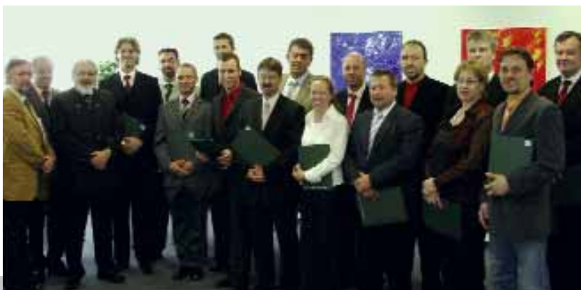
Kursabschlusstteilnehmer des 1. Thanatopraxielehrganges in Graz