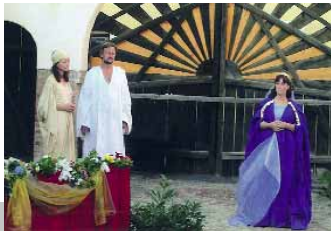
Sehr ausdrucksstark setzt das Theater Mosaik die letzten Schritte des reichen Mannes, begleitet von Glaube, Liebe und Hoffnung, auch auf der Quo Vadis 2009 um.