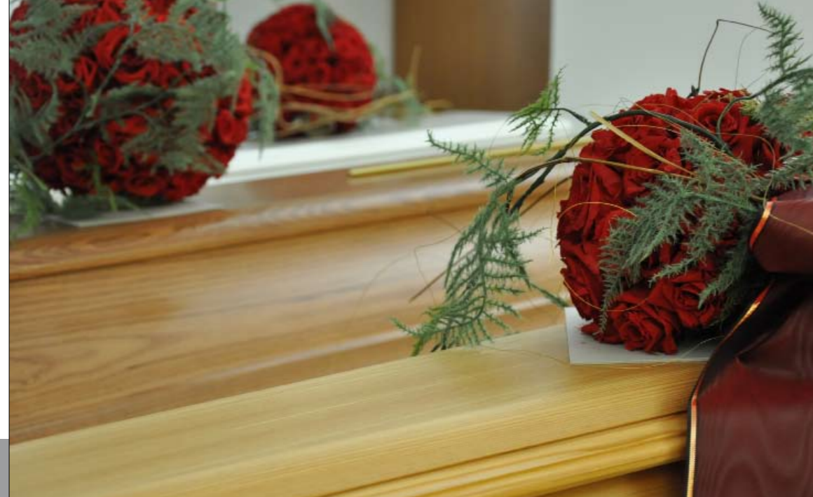
Eine Bestattung hat immer etwas von Ruhe.

So fern scheint der Tod dem Menschen. Das Wissen um die Endlichkeit verschont ihn nicht vor der Erschütterung, wird ihm ein liebes Wesen entrissen. Die Zeit steht still, angehalten vom Schmerz, und all die Wege, die zu gehen sind, werden zu schweren Aufgaben. So hat sich das Bestattergewerbe zur Dienstleistung in den schwersten Stunden entwickelt, der Beruf zur Berufung mit hoher sozialer Verantwortung.