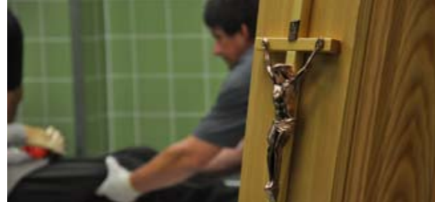
DER BERUF DES BESTATTERS IST VIELFÄLTIG. UND DIE TAGE EBENSO.

Morgens um acht treffen sie ein. Im kleinen Hinterzimmer, ausgestattet mit einer Küchenzeile. Sie trinken eine Tasse Kaffee, besprechen den Tag. „Das ist obligat bei uns“, sagt einer der drei Bestatter, die ich an diesem sonnigen Herbsttag kennen lerne. Und durch sie werde ich viel erfahren, worüber wenig gesprochen wird: Was geschieht mit uns, wenn wir tot sind? Wie viele Handgriffe werden an uns vollführt, ohne Möglichkeit, uns dagegen zu wehren? Welchen Weg nehmen wir, was macht man mit uns?