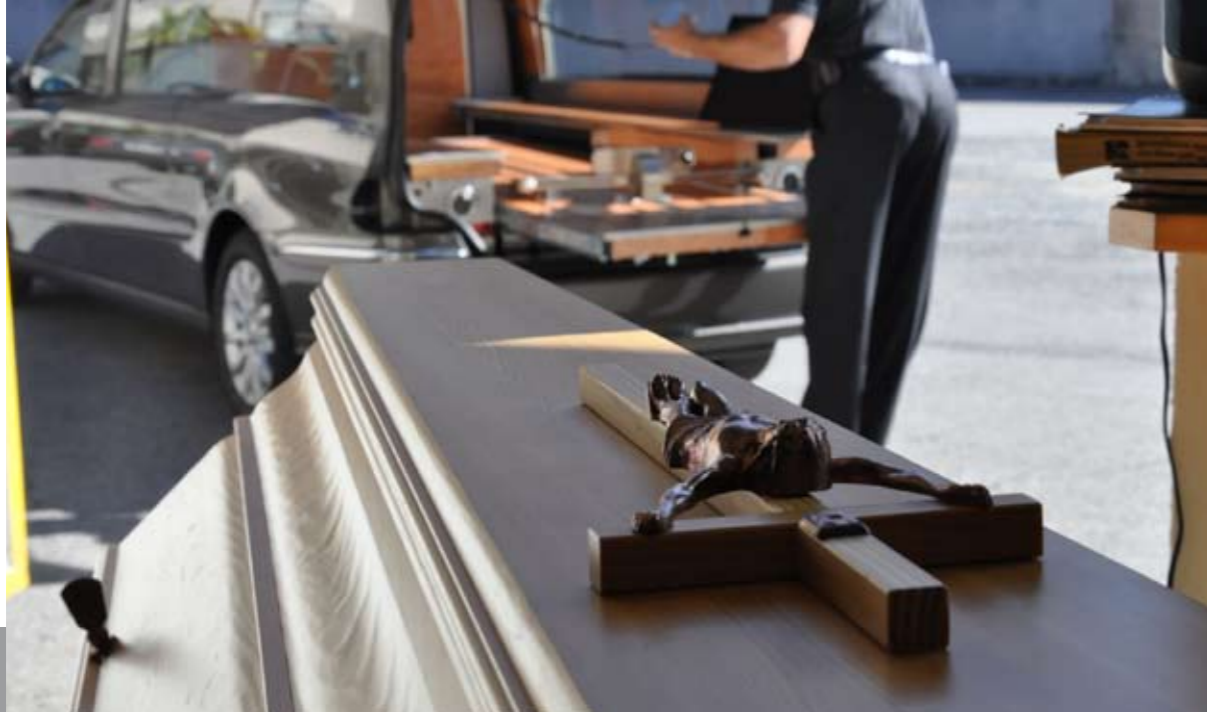
Bestatter haben gelernt, mit Menschen in Ausnahmesituationen umzugehen.

einem Glas Sekt und Brötchen verabschiedet, und dann gibt es wieder Menschen, die ganz alleine bei Kerzenbeleuchtung am Sarg sitzen“, so Wurzer.